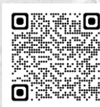
地域協議会 ホームページ